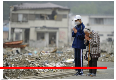
★釜石市キャラクター/かまイン、 ★川口市キャラクター/きゅぼらん